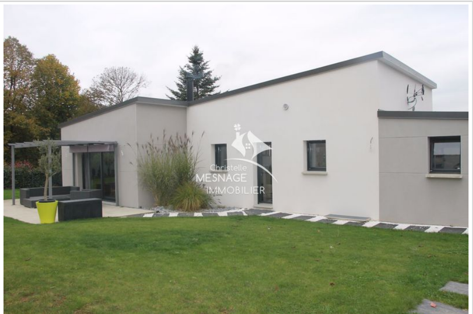
Contemporary house réf. 389V678M Dinan

find all our real estate listings on the website www.christellemesnage.com (houses, flats and land) for sale in Dinan and common léhon nearby quévert, lanvallay, taden, Trelivan, plouer sur rance